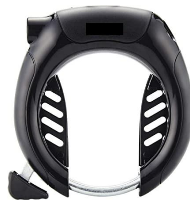
Antivol de cadre