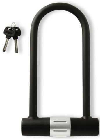
Antivol en U

Choisir un antivol noté "2 roues" : bicycode.org/test-antivol/recherche