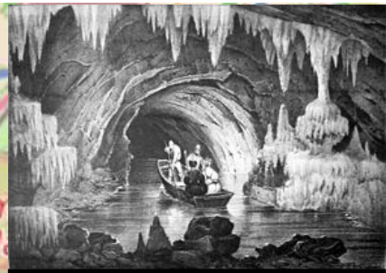
Intérieur des grottes de la Balme, gravure de Victor Cassien de 1836.