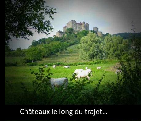
Châteaux le long du trajet...