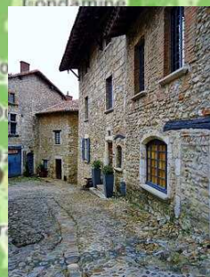
Pérouges, village médiévale réputé pour sa tarte au sucre!

Le Viaduc de Cize-Bolozon, une construction titanique! Pont ferroviaire et routier, ses dimensions impressionnantes en font un des ouvrages les plus imposants enjambant la rivière d'Ain.