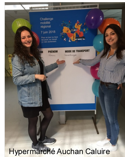
Hypermarché Auchan Caluire