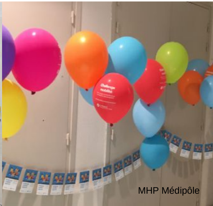
Euro Info Tassin