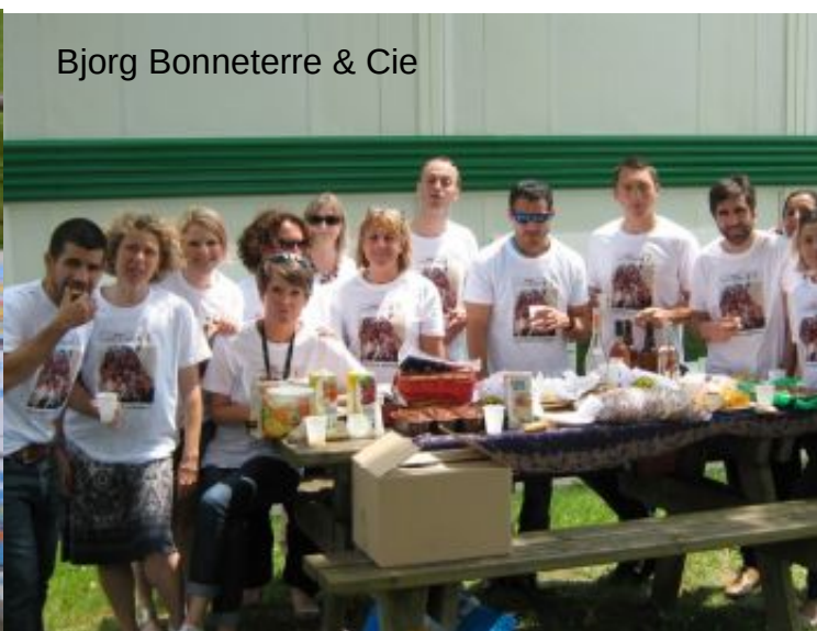
Bjorg Bonneterre & Cie